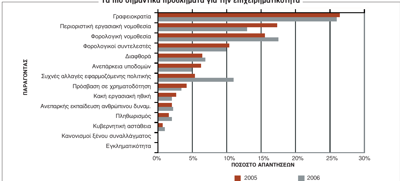
Τα πιο σημαντικά προβλήματα για την επιχειρηματικότητα

Σημείωση: Από μια λίστα με 14 παράγοντες, ζητήθηκε από τους συμμετέχοντες στην έρευνα να επιλέξουν τους πέντε περισσότερο προβληματικούς για την επιχειρηματικότητα και να τους αξιολογήσουν με κλίμακα 1 (ο περισσότερο προβληματικός) έως 5 (ο λιγότερο προβληματικός). Το διάγραμμα δείχνει τα ποσοστά απαντήσεων σταθμισμένα σύμφωνα με την αξιολόγηση του κάθε παράγοντα.