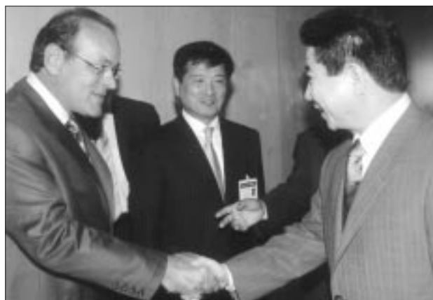
Ο πρόεδρος του ΣΕΒ κ. Δημήτρης Δασκαλόπουλος ανταλλάσσει θερμή χειραψία με τον Πρόεδρο της Δημοκρατίας της Κορέας κ. Roh Moo Hyun.

Ο κ. Λαβίδας σημείωσε ότι οι δύο χώρες μοιράζονται από μια πρωτιά. Η Ελλάδα είναι ο ηγέτης στον τομέα της εμπορικής ναυτιλίας και η Κορέα ο ηγέτης στη ναυπηγική βιομηχανία, με κύριο πελάτη τη χώρα μας. Επιπλέον οι δύο