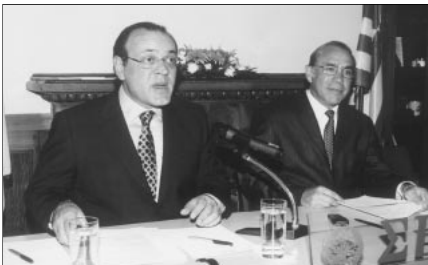
Ο πρόεδρος του ΣΕΒ κ. Δημήτρης Δασκαλόπουλος με τον νέο Πρόεδρο του Ο.Ο.Σ.Α. κ. Angel Gurría στα γραφεία του Συνδέσμου.

Ως Υπουργός Οικονομικών και Δημόσιων Πιστώσεων, σε μια διετή περίοδο έως το 2000, ο Angel Gurría σχεδίασε και υλοποίησε ένα μηχανισμό που προστάτευσε την οικονο-